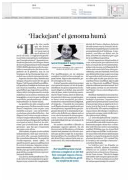
M. Esquerda “Hackejant” el genoma humà Diari ARA 7/02/2016