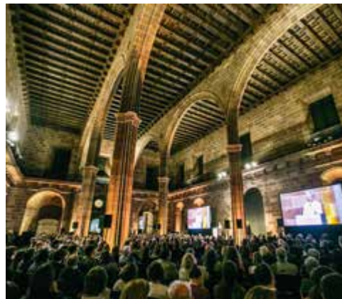
Acte central del 25è aniversari de la URL a la Casa Llotja de Mar de Barcelona

Aquest any es va celebrar els 25 anys de l'aprovació de la Universitat Ramon Lull per part del Parlament de Catalunya, l'any 1991. L'Institut Borja de Bioètica com a institució universitària de la URL es va afegir als actes que es varen celebrar durant el 2016.