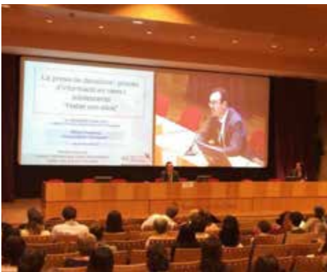
Acte d'inauguració de les Jornades

El Comitè d'Ètica Assistencial de l'Hospital Sant Joan de Déu (HSJD) i l'Institut Borja de Bioètica van ser els organitzadors de la Jornada de CEA de Catalunya d'enguany, amb el títol Ètica i Pediatria: Comunicació i Decisions .