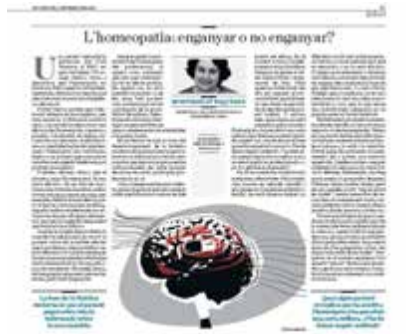
M. Esquerda L'homeopatia: enganyar o no enganyar? Diari ARA 10/3/2016