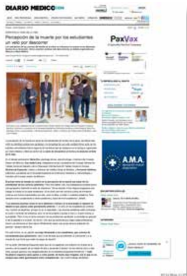
Percepción de la muerte por los estudiantes: un velo por descorrer DIARIO MÉDICO 7/11/2016