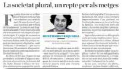
M. Esquerda La societat plural, un repte per als metges Diari ARA 7/09/2016