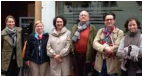
El Comitè executiu amb les directores de l'IBB

L'Institut Borja de Bioètica (IBB)-URL va rebre la visita del comitè executiu de l'European Association of Centres of Medical Ethics (EACME) , associació de la qual n'és membre fundador. Aquesta visita va permetre que el comitè executiu de l'EACME conegués de primera mà l'IBB-URL i va ser ocasió per avançar en els preparatius de l'organització de la Conferència Anual de l'EACME 2017, de la qual l'IBB-URL en serà la seu.