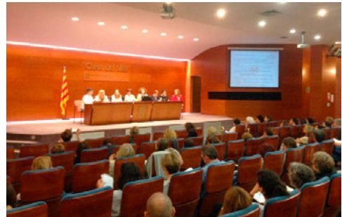
Presentació dels Comitès d'Ètica: 7 diferents visions